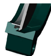
Уплотнение с эластомером