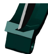
Уплотнение металл / металл