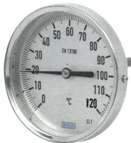
A52.025, A52.033, A52.040, A52.050, A52.063, A52.080, A52.100, A52.160