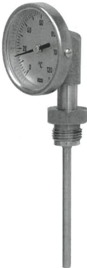
R52.063, R52.080, R52.100, R52.160