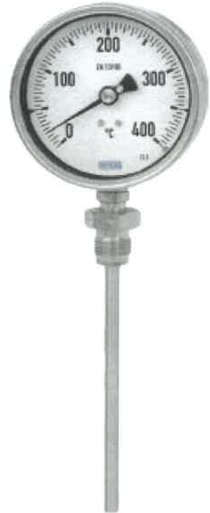
R5526, R5502, R5503, TG55