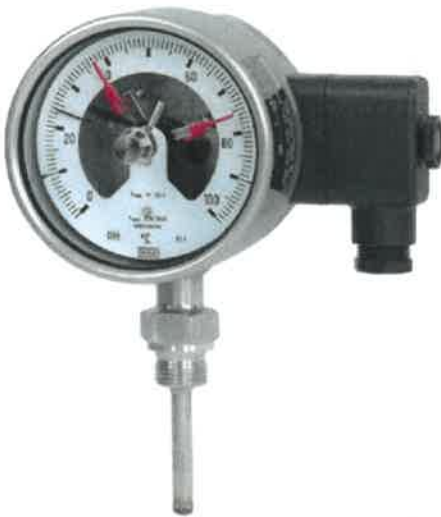
R5526, R5502, R5503, TG55