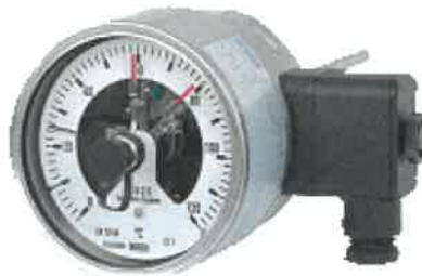
A5525, A5500, A5501, TG55