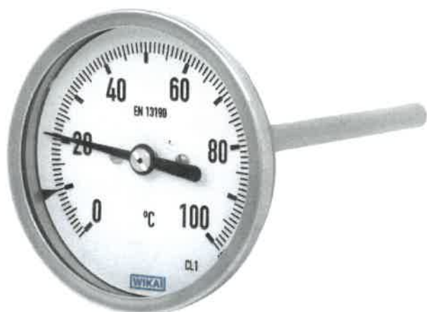
A5400, A5401, A5402, A5403