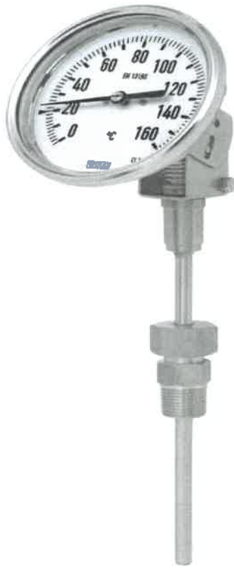
S5410, S5411, S5412, S5413