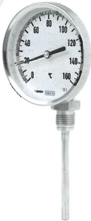
R5440, R5441, R5442, R5443