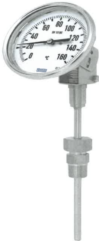
S5410, S5411, S5412, S5413